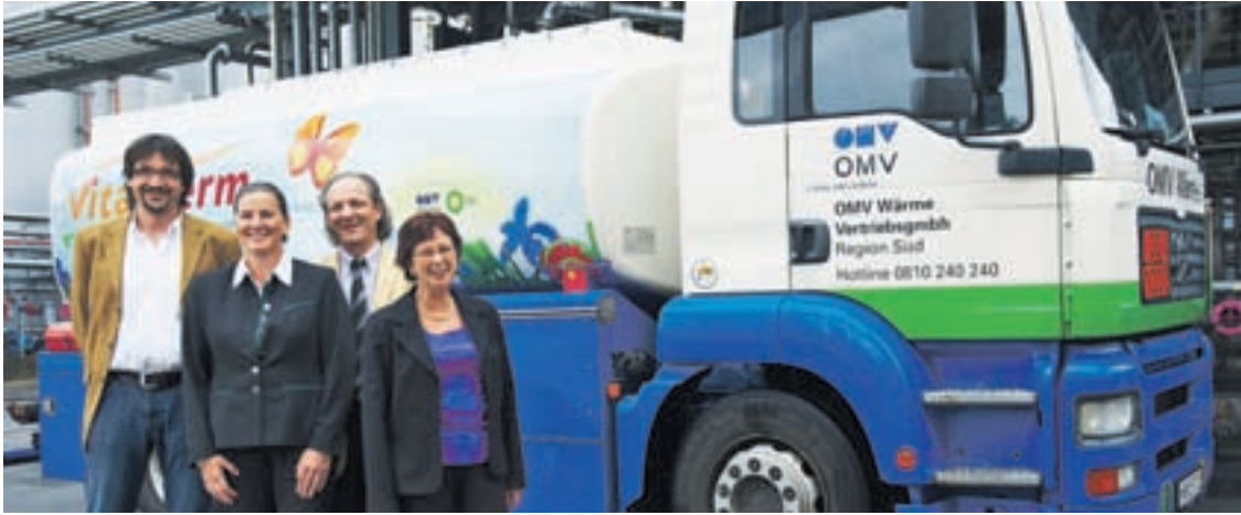
◆ Das Team der OMV Wärme VertriebsgmbH Region Süd Graz sorgt für zufriedene Kunden OMV/VITATHERM